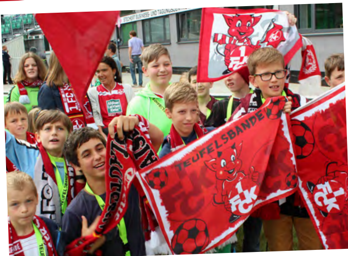
Begrüßungsrunde im Stadion beim Auswärtsspiel gegen die SpVgg Greuther Fürth am 20.09.2014