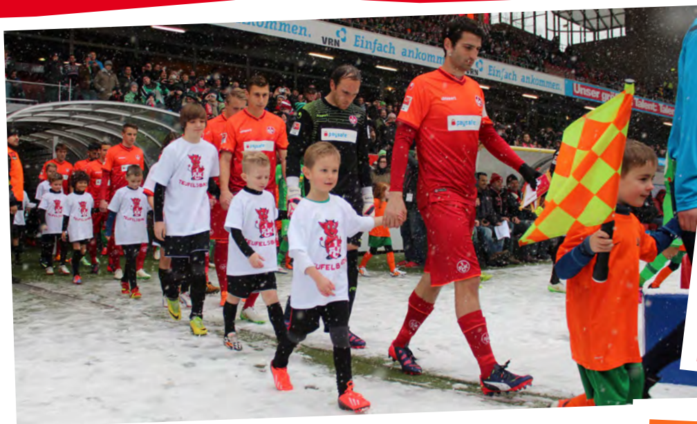
TEUFELSBANDEN-Einlaufkids beim Testspiel gegen Borussia Mönchengladbach am 24.01.2015