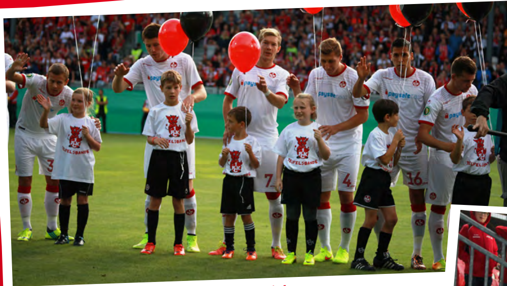
TEUFELSBANDEN-Einlaufkids beim Pokalspiel gegen den SV Wehen Wiesbaden am 16.08.2014