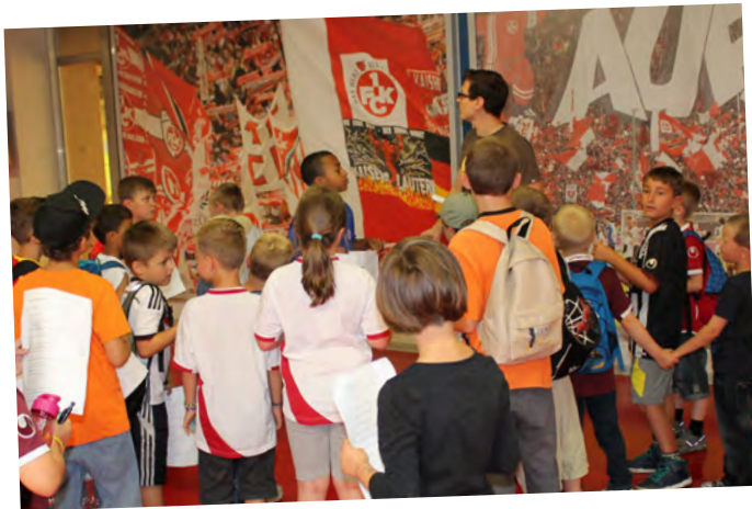
Stadionrallye beim Erlebnistag im Ferienprogramm der Stadt Kaiserslautern am 29.07.2014