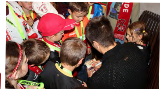
Autogrammstunde in der TEUFELSBANDEN- Erlebniswelt beim Heimspiel gegen den FSV Frankfurt am 12.09.2014