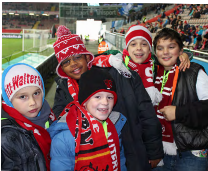
Gruppenfoto im Familienblock beim Heimspiel gegen den SV Darmstadt 98 am 21.11.2014