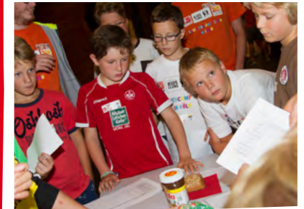
Kinder-Uni-Tag beim DFL-Sommerncamp am 05.08.2014