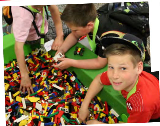
Besuch der LEGO-Ausstellung in Kaiserslautern am 24.04.2015