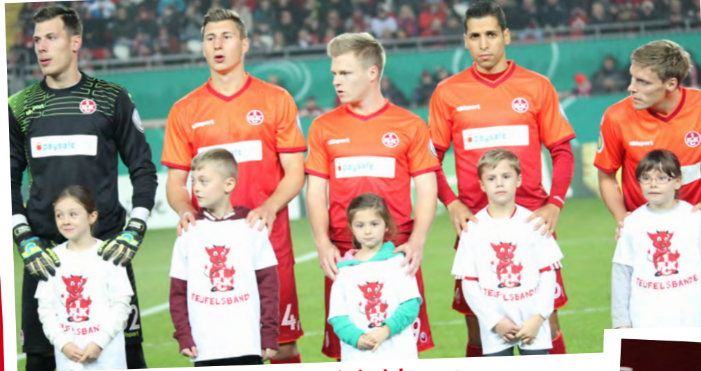
TEUFELSBANDE-Einlaufkids beim Pokalspiel gegen die SpVgg Greuther Fürth am 28.10.2014