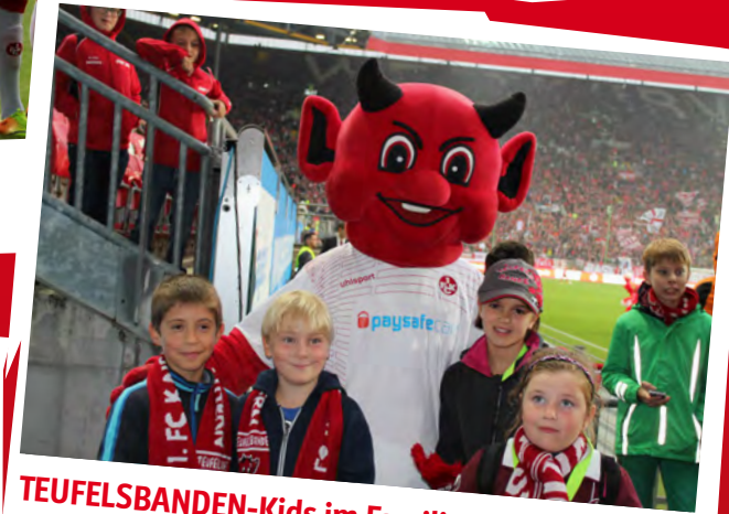
TEUFELSBANDEN-Kids im Familienblock beim Heimspiel gegen den FSV Frankfurt am 12.09.2014