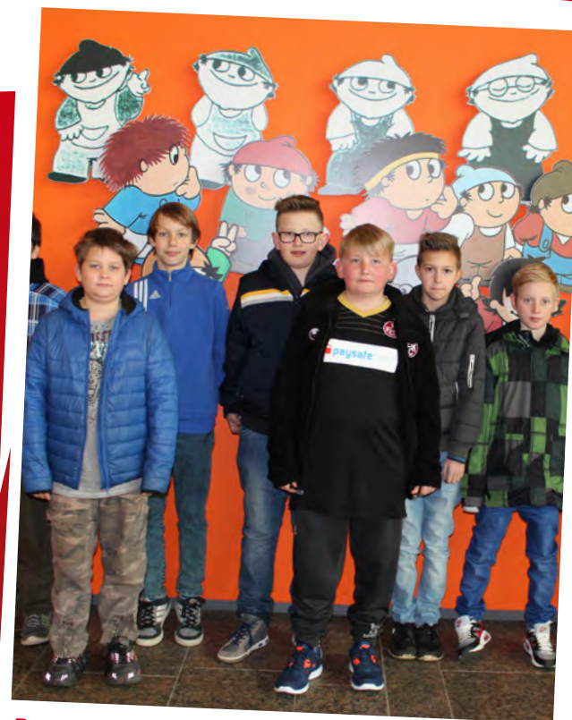
Besuch des ZDF-Sendezentrums in Mainz am 27.03.2015