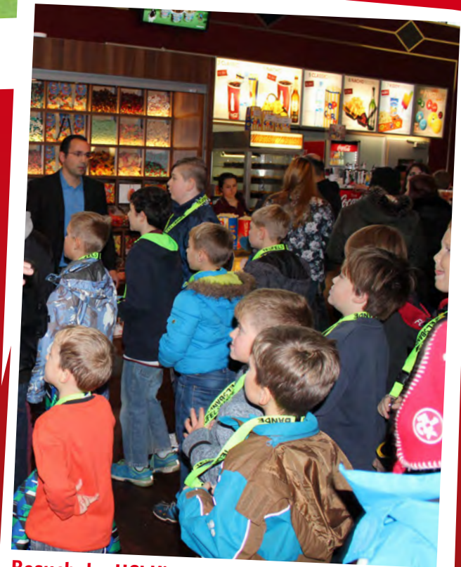
Besuch der UCI Kinowelt am 29.11.2014