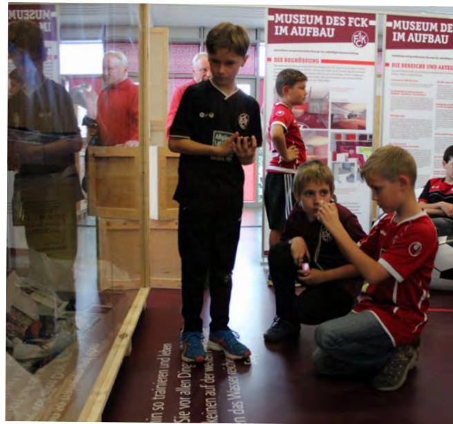
Stadionführung mit Museum am 26.09.2014