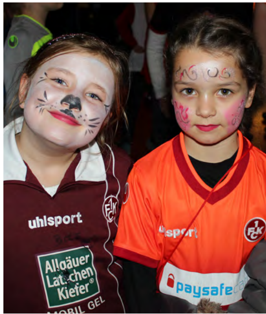
Kinderschminken bei der Kids-Club-Weihnachtsfeier am 13.12.2014