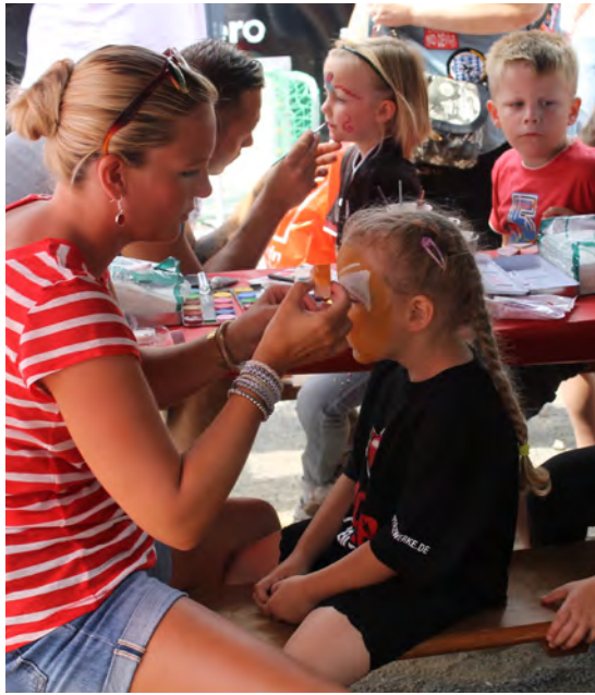
Kinderschminken beim Stadionfest am 26.07.2014